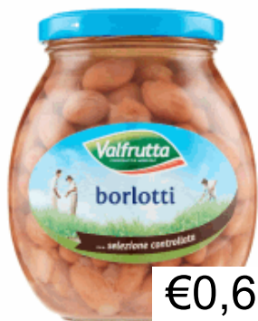
BORLOTTI GR 360 VALFRUTTA