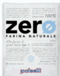
FARINA ZERO TIPO 1 KG.25 AZZUR. POLSELLI