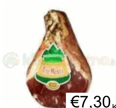
PROSC. CRUDO TRE MONTI SAN GEMINIANO