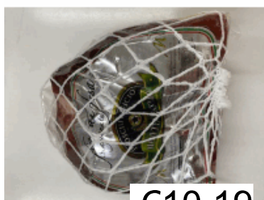
FIOR DI FESA 1/2 TRANCIO MONTEVECCHIO