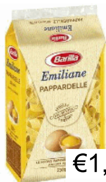
PAPPARDELLE N.176 GR.250 BARILLA