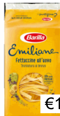
FETTUCCINE N.175 GR250 BARILLA