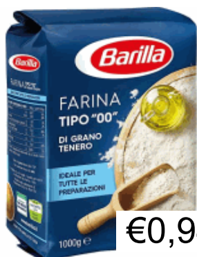
FARINA 00 KG.1 BARILLA