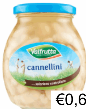
CANNELLINI GR.360 VALFRUTTA