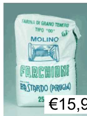
FARINA 00 SACCO DA KG.25 FARCHIONI