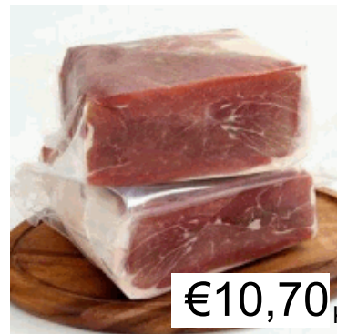
PROSC.MATTONELLA TRE MONTI