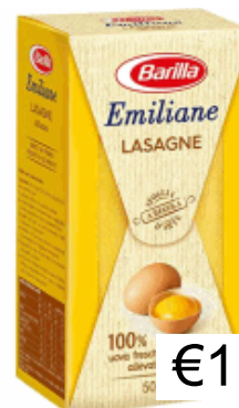
LASAGNE GR.500 N.199 BARILLA