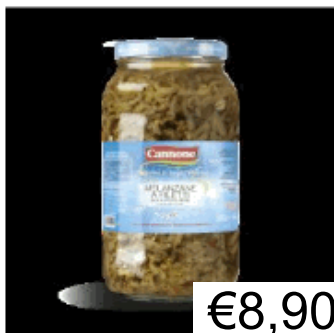
MELANZANE FILETTI KG.3 CANNONE