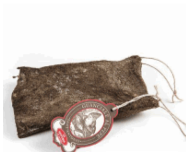
GUANCIALE STAGIONATO VALTIDONE/MONTEVECCHI O