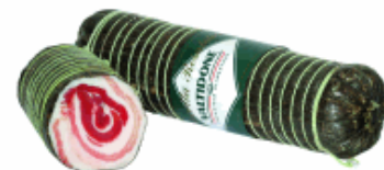
PANCETTA PEPE NERO 1/2 VALTIDONE