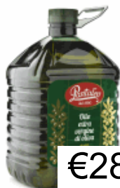
OLIO EXTRA VERG. LT 5 PANTALEO