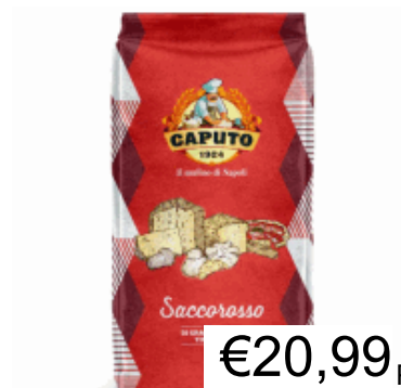
FARINA 00 RINFORZATO KG.25 CAPUTO