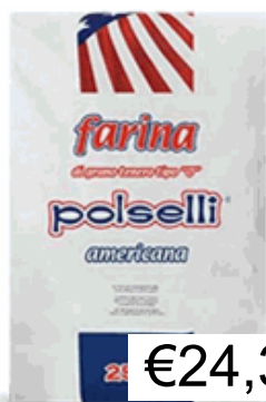
FARINA AMERICANA KG.25 POLSELLI