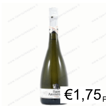
BUON ANNIVERSARY DOLCE CL75 BOSCA