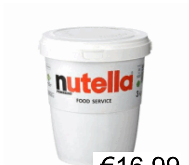
NUTELLA KG.3 FERRERO