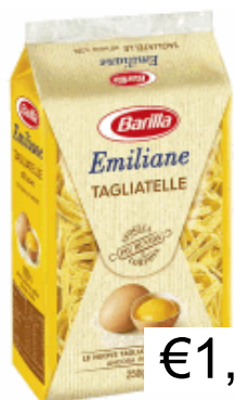
TAGLIATELLE N 174 GR 250 BARILLA