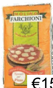
FARINA 00 KG. 25 PIZZA FARCHIONI